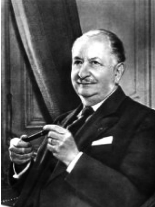
Люсьен Февр (1878–1956)

«Когда перелистываешь его сочинения, то кажется, будто он прожил больше, чем сто лет», — говорит французский писатель, философ-просветитель и драматург, основатель «Энциклопедии, или Толковый словарь наук, искусств и ремёсел», иностранный почётный член Петербургской академии наук Д. Дидро (1713–1784) (в статье, посвященной памяти Н. А. Буланже и напечатанной в приложении к первому тому «Разоблаченной древности» ( L'Antiquite devoilee par ses usages, ou Examine critique des principales