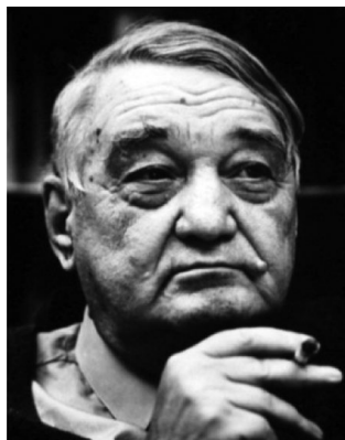
Л. Н. Гумилев (1912–1992)

С самого зарождения евразийского движения П. Н. Савицкий являлся одним из его главных теоретиков и политических лидеров. Он создал базовые для евразийства теории месторазвития, хозяйстводержавия, циклов экономической истории, циклов ев-