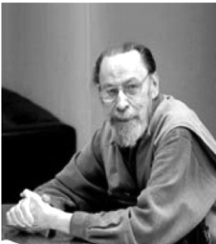
П. Н. Савицкий (1895–1968)

любви к ближнему. Это — иная мораль» (Бердяев Н. А. Константин Леонтьев. Очерк из истории русской религиозной мысли // Бердяев Н. А. Константин Леонтьев. Очерк из истории русской религиозной мысли. Алексей Степанович Хомяков. — М.: АСТ: АСТ МОСКВА: ХРАНИТЕЛЬ, 2007).