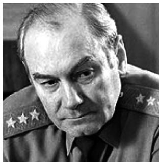
Генерал-полковник Л. Г. Ивашов (1943)

Следует отметить, что и в отечественной науке геополитическая мысль с географической точки зрения в первой половине XX в. находилась на достаточно высоком уровне. Методологической основой российской геополитики, вытекающей из закономерностей ее объективного исторического развития, явилось евразийство. Среди отечественных ученых в этой области в первую очередь выделялся Г. В. Вернадский.