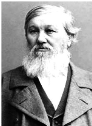
Данилевский Николай Яковлевич (1822–1885)

В частности, в книге «Россия и Европа» (Данилевский Н. Я. Россия и Европа. — М.: ИЦ «Древнее и современное», 2002. — 550 с.), Н. Я. Данилевский отмечает: «В продолжение этой книги мы постоянно проводим мысль, что Европа не только нечто нам чуждое, но даже враждебное, что её интересы не только не могут быть нашими интересами, но в большинстве случаев прямо им противоположны... Если невозможно и вредно устранить себя от европейских дел, то весьма возможно, полезно и даже необходимо смотреть на эти дела всегда и постоянно с нашей особой русской точки зрения, применяя к ним как единственный критерий оценки: какое отношение может иметь то или другое событие, направление умов, та или другая деятельность влиятельных личностей к нашим особен-