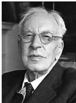
Арнольд Дж. Тойнби (1889–1975)

Английский историк, философ Арнольд Дж. Тойнби (1889–1975) в своей двенадцатитомной работе «Постижение истории» выделил 21 существовавшие в истории цивилизации и дал им классификацию: египетская, андская, древнекитайская, минойская, шумерская, майянская, сирийская, индская, хеттская, эллинская, западная, дальневосточная (в Корею и Японию), православная христианская (основная, в Византии и на Балканах), православная христианская, дальневосточная (основная), иранская, арабская, индуистская, мексиканская, юкатанская, вавилонская.