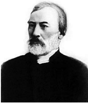
К. Н. Леонтьев (1831–1891)