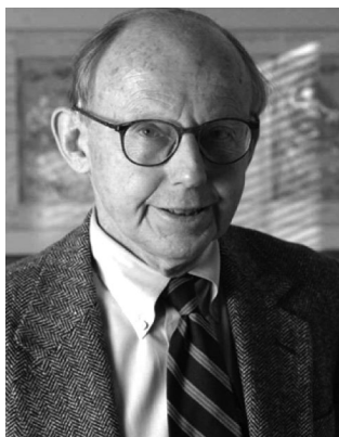
Сэмюэл Филлипс Хантингтон (1927–2008)

Отвечая на многочисленные критические замечания о предлагаемой им теории, С. Ф. Хантингтон связал воедино темы демократии, модернизации, упадка. По его мнению, влияние Запада на общем фоне усиливающегося фундаментализма разного толка и многообразных культурно-интеграционных тенденций внутри цивилизаций постепенно снижается. Для анализа современного уклада мира интересна следующая точка зрения профессора: «Во-первых, существует мнение, что крах советского коммунизма означает конец истории или повсеместную победу либеральной демократии в мире. Этот довод страдает от ошибочности Единой Альтернативы. Он коренится в характерном для эпохи холодной войны допущении, что единственной альтернативой коммунизму является либеральная демократия, следовательно, из кончины первого рождается универсализм второй. Впрочем, очевидно, что существует множество форм авторитаризма, национализ-