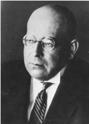
О. Шпенглер (1880–1936)