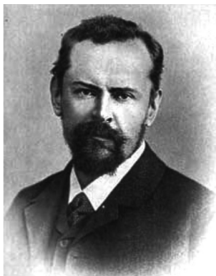
Н. С. Трубецкой (1890–1938)