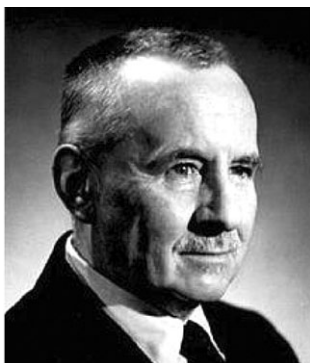
Г. В. Вернадский (1887–1973)