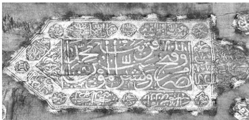
Знамя Пророка, при взятии Хайбара

Инженер по профессии, Н. А. Буланже был в то же время и признанным философом в том широком смысле, какой придавался этому слову в XVIII веке.