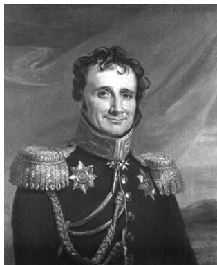
Генерал Антуан-Анри (Генрих Вениаминович) Жомини (1779–1869)

В своих трудах, например, в «Очерке военного искусства», А. Жомини изложил общие принципы войны. Он также подчеркивал и на деле практиковал постулат: соблюдение моральных норм – это непре-