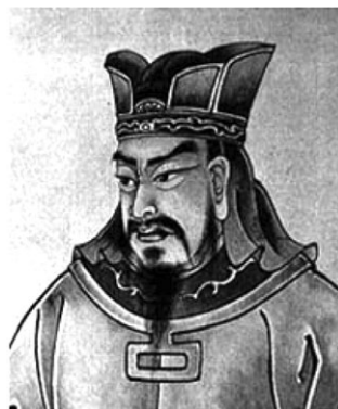
Китайский стратег и мыслитель Сунь-Цзы (54 н. э. – 496 до н. э.)

С. Ю. Фронтин находит эти хитрости у многих античных авторов, описывавших различные войны. Такие хитрости были рассыпаны по многочисленным сочинениям греков и римлян. Автор «Военных хитростей» определил свою главную цель как собрание наиболее продуманных и удачных решений полководцев в одну книгу. Он не считал свой труд литературным произведением, а придавал ему утилитарно-технический характер. Главное для