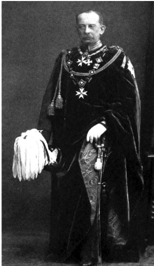
А. фон Шлиффен (1833–1913)