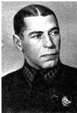
Маршал Б. М. Шапошников (1882–1945)

Маршал Б. М. Шапошников внёс значительный вклад в теорию и практику строительства Вооружённых сил СССР, в их укрепление и совершенствование, подготовку военных кадров. Он много и успешно работал над развитием военной науки, над обобщением боевого опыта Первой мировой и Гражданской войн. Участвовал в комиссии по разработке уставов, отражая в них основные положения военной доктрины СССР.