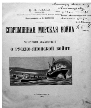
Н. Л. Кладо «Современная морская война»

В своем важнейшем научном труде «Этюды по стратегии» Н. Л. Кладо взял на себя смелость проанализировать взгляды на проблему взаимосвязи принципов военной стратегии и геополитики ведущих военных теоретиков различных стран мира, например, генерала Г. Ллойда (1720–1783), генерала Антуана-Анри (Генрих Вениаминович) Жомини (1779–1869), генерала Карла Филиппа Готтлиба фон Клаузевица (1780–1831), генерала от инфантерии, профессора военного искусства Генриха Антоновича Леера (1829–1904), германского генерала от кавалерии, военного писателя и историка Фридриха фон Бернгарди (1849–1930), американского военно-морского теоретика и историка, контр-адмирала, одного из основателей геополитики Альфреда Тайера Мэхэна (1840–1914) и др.