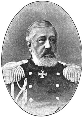
Генрих Антонович Леер (1829 – 1904)

реформ 1860–1870-х гг. и перевооружение российской армии. По своим строго научным трудам Г. А. Леер стоял в первых рядах выдающихся военных мыслителей и писателей. Своими исследованиями он оказал громадную услугу военному делу вообще, и русскому в частности, и многие его прогрессивные идеи были реализованы в Русской Армии.