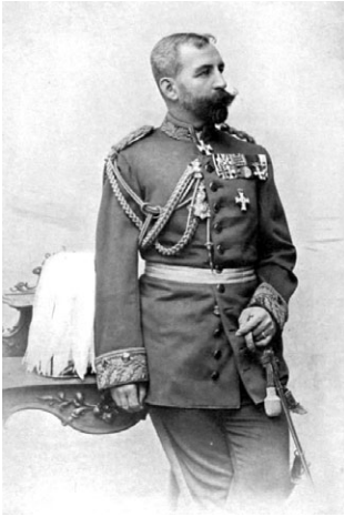
Фридрих фон Бернгарди (1849–1930)