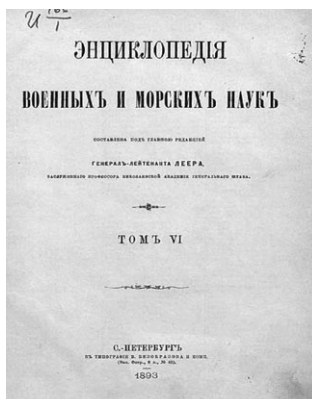
«Энциклопедия военных и морских наук»

Германский генерал от кавалерии, военный писатель и историк Фридрих фон Бернгарди (1849–1930) выпустил ряд научных работ по общим вопросам военного искусства. Среди них — «Элементы современной войны» (1898); по организации германской армии — «Развитие германского вермахта» (1898), а также в области кавалерии — «Служба конницы». В 1912 году Ф. Бернгарди издал широко обсуждавшийся в военных кругах как Германии, так и других стран военный труд «Германия и будущая война» (в русском переводе — «Современная война», СПб, 1912), в котором он писал: «Наши политические задачи не выполнимы и не разрешимы без меча». Он считал, что для приобретения «положения, которое соответствует мощи нашего народа», война необходима; война должна стать обеспечением будущего развития Германии, а ее цель — добиться мирового могущества и создать колониальную империю. Ф. Бернгарди опровергал тезис прусского генерал-фельдмаршала, начальника немецкого Генерального штаба с 1891 по 1905 год А. фон Шлиффена (1833–1913) о том, что война может быть только скоротечной. Сторонник жестких методов ведения войны, он считал, что в войне нельзя останавливаться ни перед чем, чтобы нанести поражение противнику и принудить его к капитуляции.