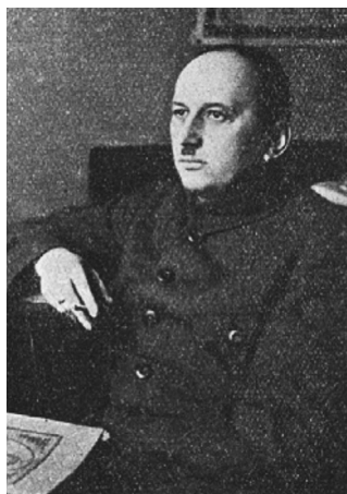
А. А. Свечин (1878- 1938)

Более того, А. А. Свечин и Маршал Советского Союза, выдающийся советский военный и государственный деятель, военный теоретик Б. М. Шапошников (1882–1945) первыми среди советских авторов 1920-х — 1930-х гг. внесли наиболее весомый вклад в рассмотрение вопросов соотношения между политической и военной стратегией. В частности, А. А. Свечин мысль о примате политики по отношению к стратегии развил и углубил в своем главном труде — «Стратегия», вышедшем двумя изданиями в 1926 и 1927 годах. Здесь он весьма категорично заявил о праве политики вмешиваться в стратегию, в военные операции. Однако А. А. Свечин имел в виду продуманное, научно обоснованное вмешательство.