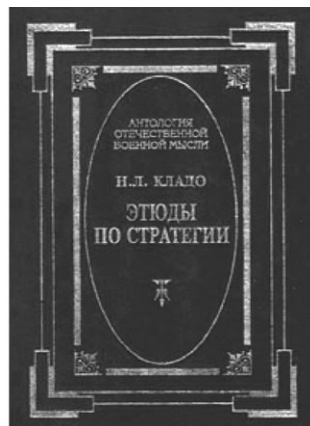
Н. Л. Кладо «Этюды по стратегии»