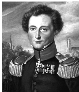
Карл Филипп Готтлиб фон Клаузевиц (1780–1831)

тором американцы по праву сильного навязывают миру свою идеологию, мораль и религию в результате военного воздействия или его угрозы. В свое время А. Жюмини писал: «Вторжение в землю неприятельскую без справедливой причины есть преступление против человечества...». Констатируя наступление эпохи массовых войн, когда «целые народы призываются к оружию и сражаются не за назначение границ, но некоторым образом за своё существование», он высказывал со-