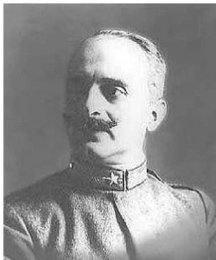
Джулио Дуэ (1869–1930)

В 1911–1912 гг. Италия вела колониальную войну в Ливии и впервые в истории войн применила самолеты для разведки и бомбардировки. Д. Дуэ не только активно участвовал в боевых действиях, но и на основании приобретенного опыта опубликовал «Правила обращения с военными самолетами» (1913). По собственной просьбе он назначается командиром первого военно-воздушного подразделения Италии — авиационного батальона (1912). Он же написал первый устав ВВС Италии. Первую мировую войну Дж. Дуэ встретил начальником штаба дивизии. Знание военно-политической обстановки, боевых и военно-технических возможностей воюющих сторон позволило ему верно оценить геополитическую ситуацию в мире, предсказать победу Антанты над Тройственным союзом и предложить Италии (как осуществление национальной стратегии и для решения стоящих перед нацией задач) немедленно вступить в войну на стороне Антанты.