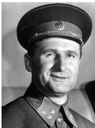
В. Д. Соколовский (1897–1968)

рона (и СССР и США имели в этом отношении аналогичные стратегии) могла быть представлена мировому общественному мнению как потенциальный агрессор, СССР пересмотрел свою военную стратегию. Была принята новая военная доктрина, имевшая исключительно оборонительный характер, а в боевые уставы всех видов Вооруженных сил внесены изменения о том, что ядерное оружие может быть применено лишь в ответ на применение его противником. Политическое руководство СССР сделало несколько заявлений на